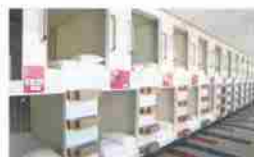
(左)ボックスベッド (下)レストランのテラス

宿泊棟1階にあるワイルドナイツのチームオフィシャルグッズショップ。選手が目の前で練習している中で、ゆっくり手に取りお買い物を。他にもリーグワン参入チームのグッズや国内外のラグビーウェアやグッズも。ワイルドナイツファンクラブ受付やチケット情報などファンの皆様の空間です。