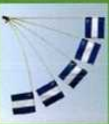
コーナーフラッグを正しく設置する位置